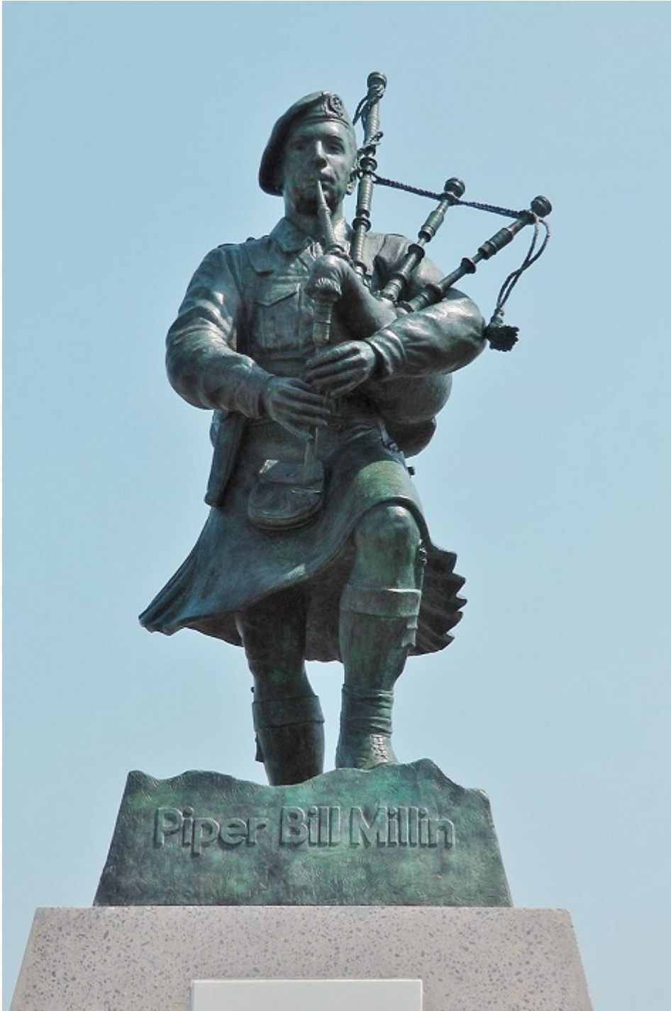
Monumento en honor a Millin en Colleville-Montgomery.